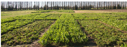
Captain CSP (Mitte) zeigt am 30. Juli auf Courtenay 190m ASL seinen signifikanten Ertragsvorteil gegenüber anderen Sorten.

Erste Untersuchungen zeigen, dass Wegerich die N-Auswaschung über eine Reihe von Mechanismen abschwächen kann, einschließlich direkter Aktivitäten auf die N-Mineralisierung des Bodens und der direkten Aufnahme von N durch Wachstum. Die stärkere Aktivität von Captain CSP in der kühlen Jahreszeit wird diese beiden Mechanismen verbessern, wenn dies am dringendsten benötigt wird, da die N-Auswaschung hauptsächlich dann erfolgt, wenn die Böden im Spätherbst, Winter und Vorfrühling nass sind.